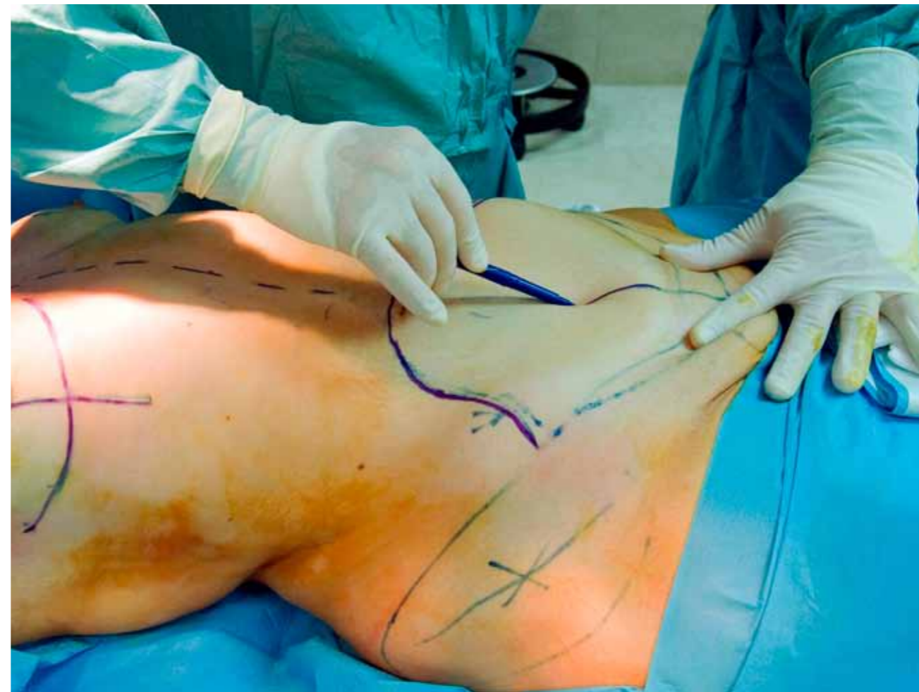
Plastický chirurg Andrej Sukop při kosmetických operacích (abdominoplastika) odstraňuje břišní tkáň, aby byly ženy štíhlejší. Břišní lalok je však při rekonstrukčních operacích důležitým zdrojem tkáň například pro vytvoření nového prsu po jeho odstranění.

Obecně se chrupavka běžně používá při mnoha rekonstrukcích, ať už je to nos nebo například boltec. Stejně tak se při defektu kůže odebere transplantát (tenký plátek kůže) ze stehna nebo z břicha a přenáší se někam jinam, kde se to přihojí. Jde většinou o menší objemy tkání, které jsou schopny se bez vlastního cévního zásobení přihojit. U větších tkáňových přesunů na vzdálené místo již musíme využít mikrochirurgickou techniku, kdy přenášené laloky musí mít vlastní cévní stopku, kterou napojíme na cévy. Pohybujeme se v řádu 1–5 mm v průměru. Pokud se vše přihojí, získáme velmi kvalitní tkáň s vlastním krevním autonomním zásobením.